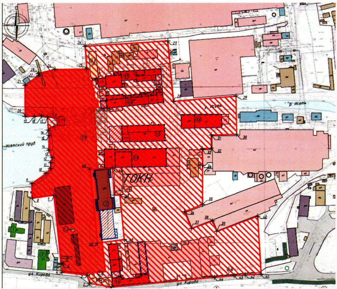
Условные обозначения к карте (схеме) границ территории Объектов