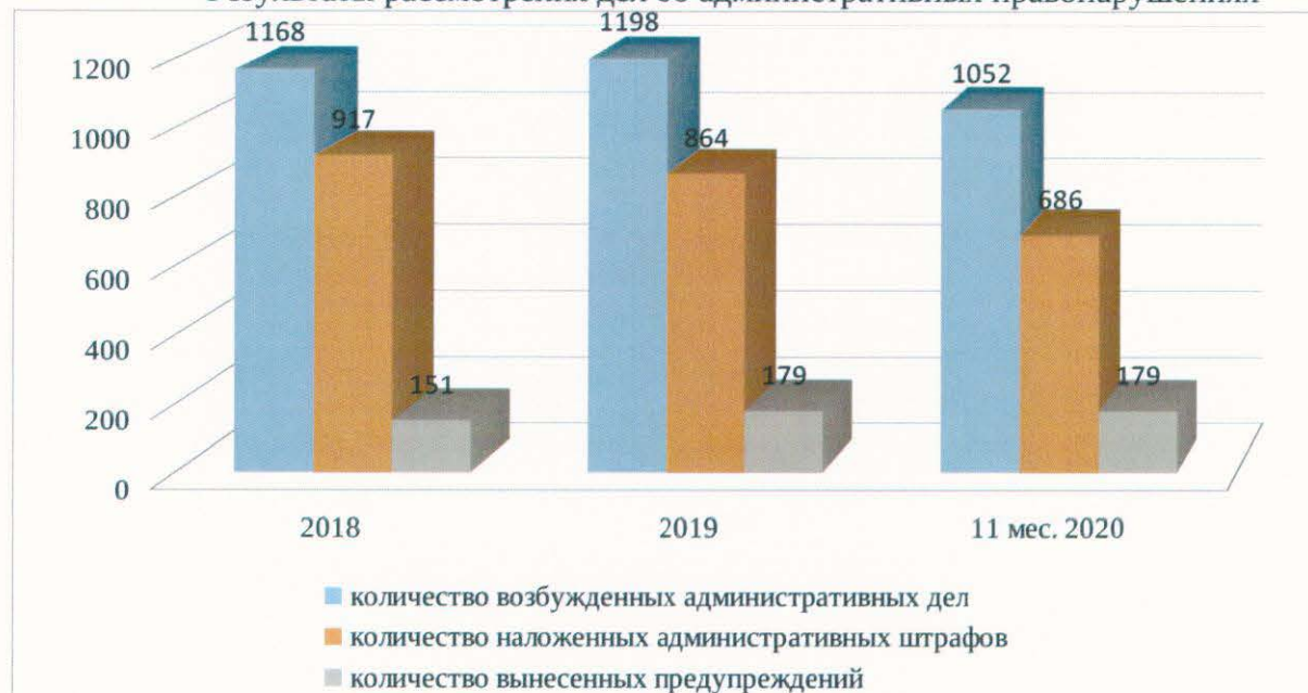
Результаты рассмотрения дел об административных правонарушениях

Анализ представленных показателей выявил снижение в 2020 году количества проведенных в отношении юридических лиц и индивидуальных предпринимателей проверок, а также выявленных нарушений и выданных предписаний. Между тем, количество проверок прокуратуры, территориальных органов Министерства внутренних дел Российской Федерации и Управления Федеральной службы безопасности Российской Федерации по Свердловской области, проведенных с участием должностных лиц Министерства, остается на прежнем уровне.