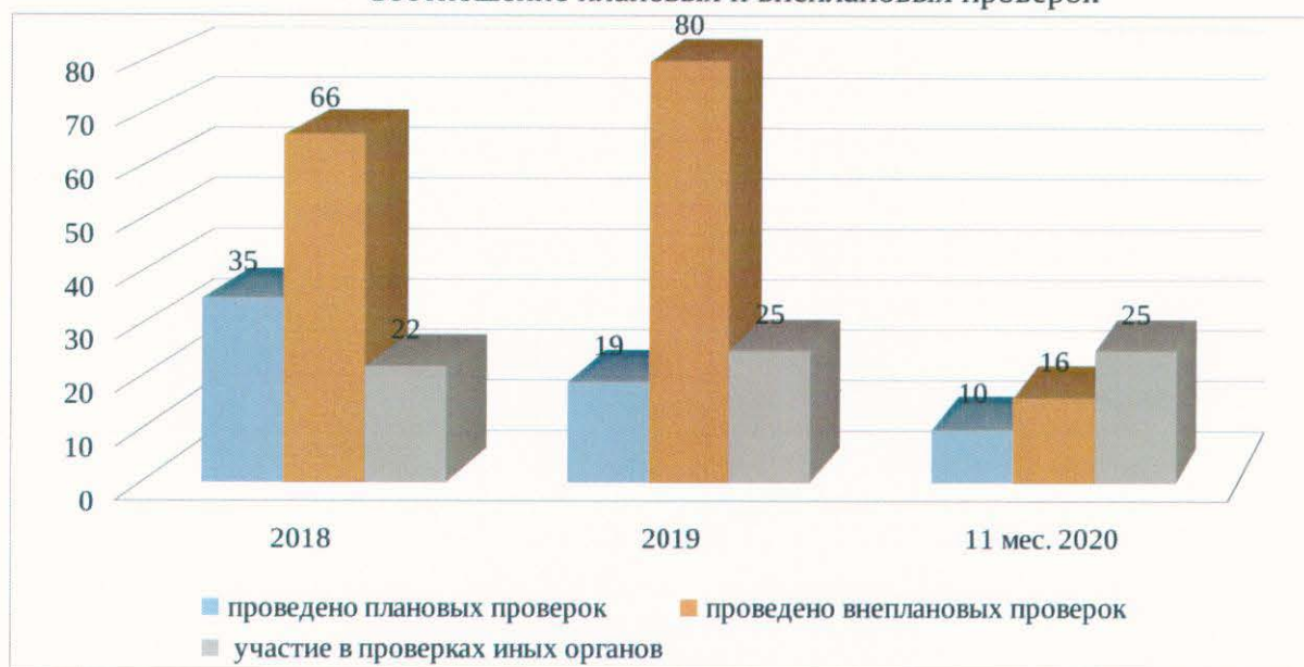
Соотношение плановых и внеплановых проверок

Анализ представленных показателей выявил снижение в 2020 году количества проведенных в отношении юридических лиц и индивидуальных предпринимателей проверок, а также выявленных нарушений и выданных предписаний. Между тем, количество проверок прокуратуры, территориальных органов Министерства внутренних дел Российской Федерации и Управления Федеральной службы безопасности Российской Федерации по Свердловской области, проведенных с участием должностных лиц Министерства, остается на прежнем уровне.