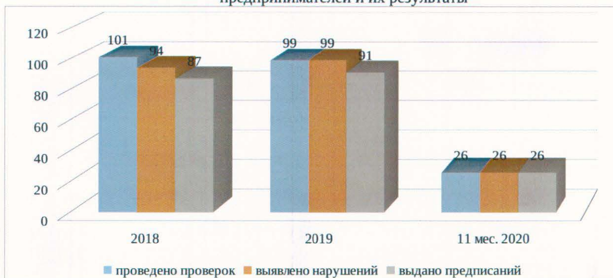
Количество проведенных проверок в отношении юридических лиц и индивидуальных предпринимателей и их результаты

Из приведенных данных мы видим снижение количества проведенных проверок за 11 месяцев 2020 года в сравнении с аналогичными периодами предыдущих лет.