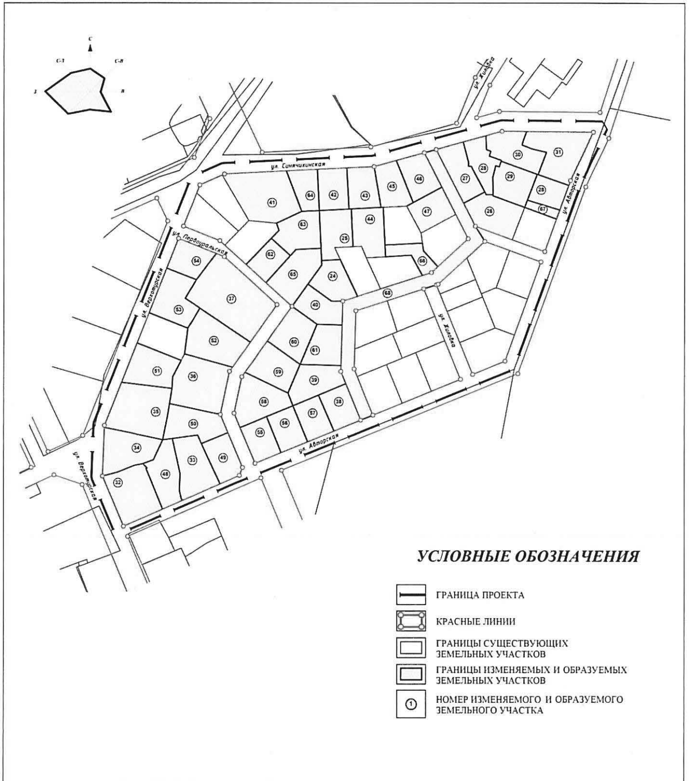
Схема межевания территории

Приложение № 3 к приказу Министерства строительства и развития инфраструктуры Свердловской области от 20.11.2017 № 1218-П