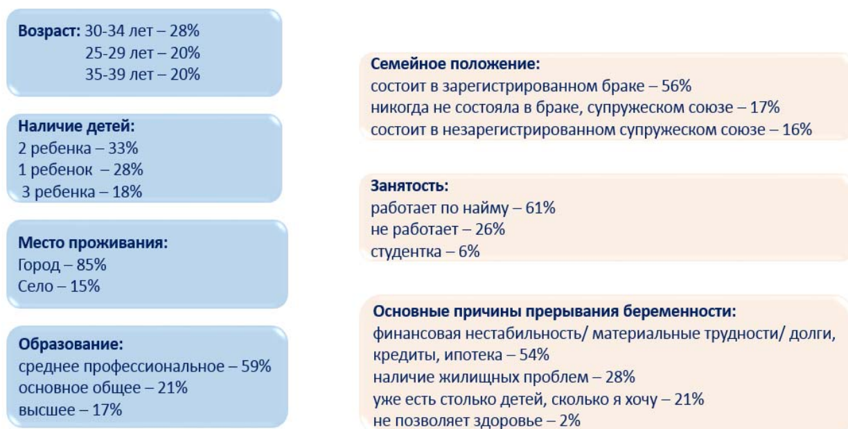
Рис. 3. Характеристика женщины, желающей прервать беременность

По итогам 2021 года реализовано 81 356 услуг медико-психологической помощи в кабинетах медико-социальной помощи (в 2020 году – 81 356), предотвращено 16 отказов от новорожденных детей (в 2020 году – 42). Эффективность доабортного консультирования представлена в таблице 7.